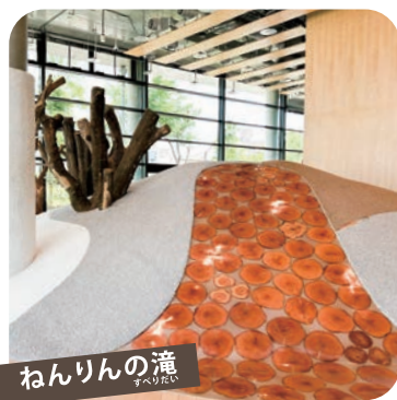
ねんりんの滝 ツバクリたい