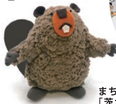
まちなかの森もっくる案内人 「茨木キテ」さん