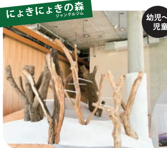
によぎによぎの森 ツマギルゾク