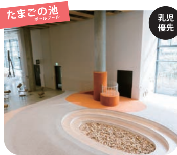
たまごの池 ボールプール